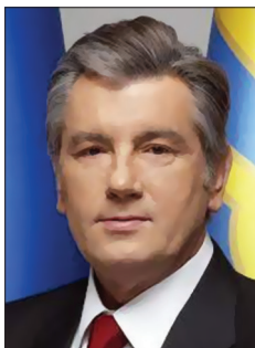
Президент України Віктор Андрійович Ющенко 2005–2010 рр.